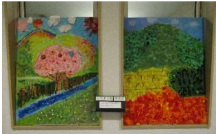
ステンシルで春と秋の景色を表現した作品です。